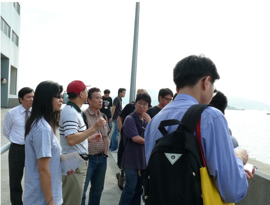
團員參觀廢物轉運港口