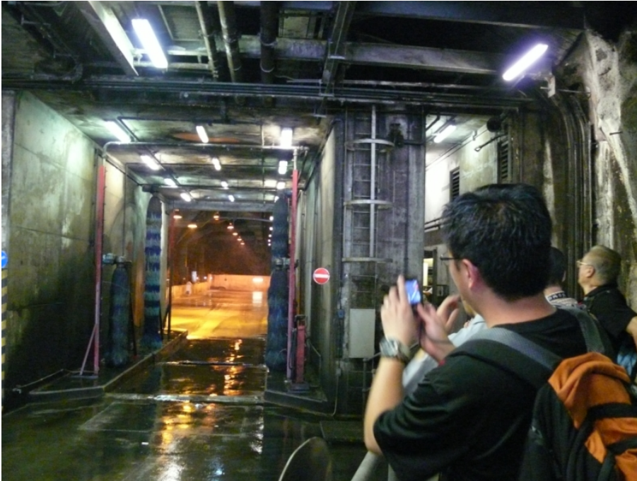
團員參觀站內設施的運作